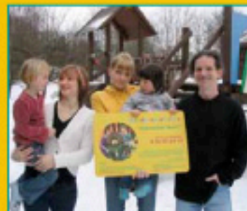
Integrativer Kindergarten in Höhn