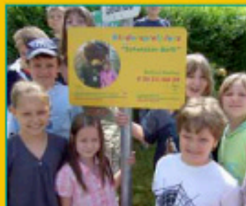
Grundschule in St. Julian

Zwei von 50 Teilnehmern, die schon einen „Schutzbär-Bulli-Spielplatz“ haben.